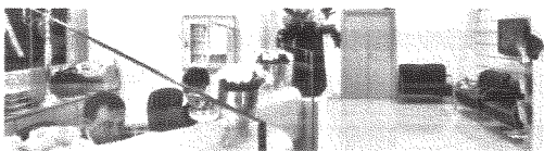
Via Piave, 76