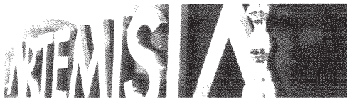
Via Velletri, 10 - LABORATORIO CITOISTOPATOLOGIA