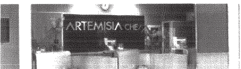
Via Sermoneta, 38/50