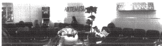
Via G. M. Lancisi, 31